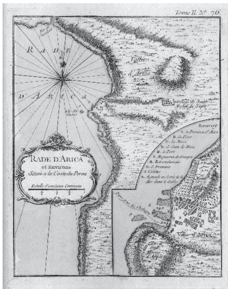
Puerto de Arica. En Jacques Nicolas Bellin, Le petit atlas maritime: recueil de cartes et plans des quatre parties du monde , París, s.n., 1764.